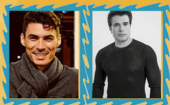
JACKIS ROBERTO DESIGN DE LUZ