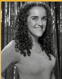
NATÁLIA LANA CENOGRAFIA