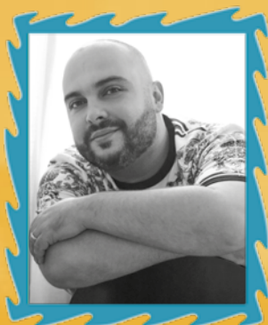
BRUNO OLIVEIRA FIGURINO